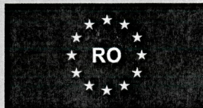
Model al Comunității Europene

Parkkarte für Behinderte; Parkkarte für Personen mit Behinderungen; Parkeerkaart voor personen met een handicap; Carte de stationnement pour handicapé; Карта за паркиране за лица с увреждания; Κάρτα στάθμευσης για άτομα με ειδικές ανάγκες; Parkimiskaart puudoga inimestele; Parkovací karta pro zdravotní postižené osoby; Parkeringsintyg för handikappade; Handicapskiit; Parkolási engedély mozgáskorlátozott személy részére; Parking card for people with disabilities; Contrassegno d'Invalidita per persone disabili; Automobili statymo kortele neigaliesiems; Invalidu stavietu izmantošanas karte; Parkschäin für behindert Leit; Parkeerkaart voor gehandicaptent; Cartão de estacionamento para pessoas com deficiência; Parkovača karta pre zdravotne postihnuté osoby; Karta parkingowa dla osób niepełnosprawnych; Card de parcare pentru persoanele cu dizabilități; Parkirna karta za invalide; Parkeringsintyg för handikappade; Tarjeta de aparcamiento para minusválidos.